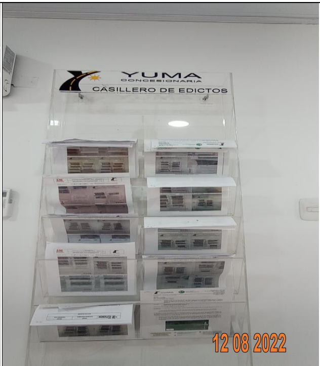
EDICTO R_34714 YC-CRT-117667