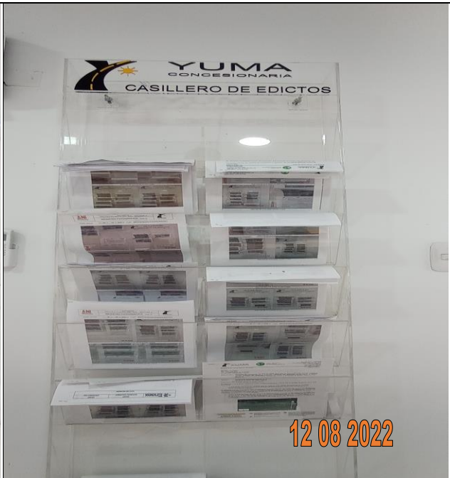
EDICTO R_34714 YC-CRT-117667